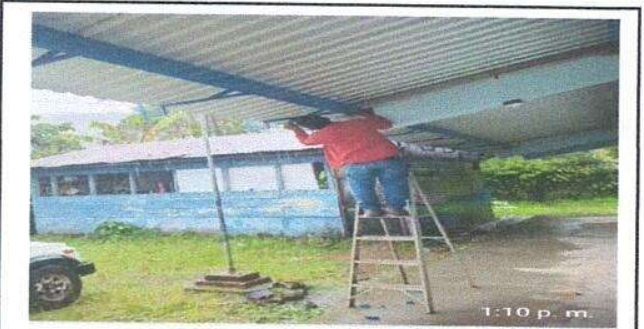
Foto 5: Sustrucción de canal, Sustrucción de soporte o pescante de metal para canal