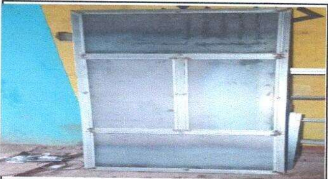
Foto 3: Mantenimiento a estructura (lijado, cambio de tubo, cepillado, sujeciones)